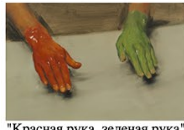
"Красная рука, зеленая рука"