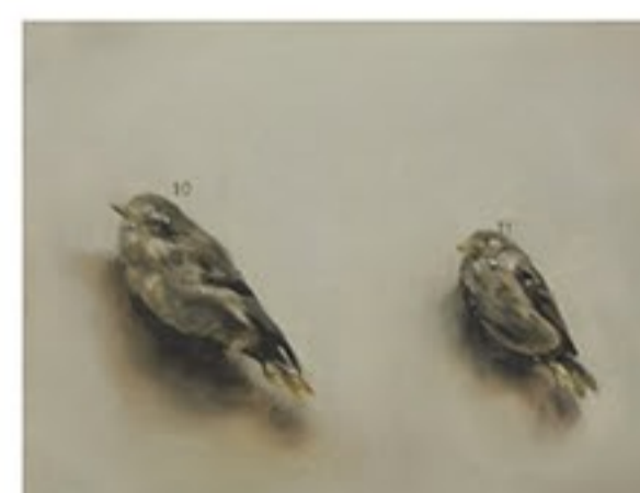
"10 и 11"