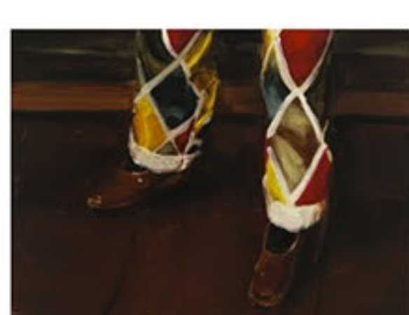
"Такой же дурак"