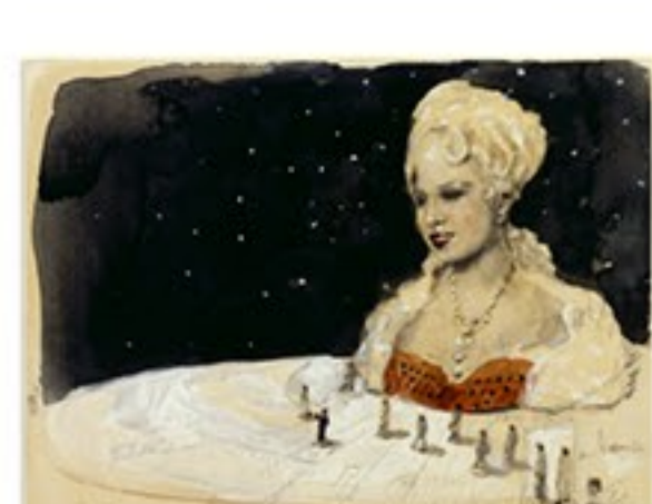
"A Mae West Experience"