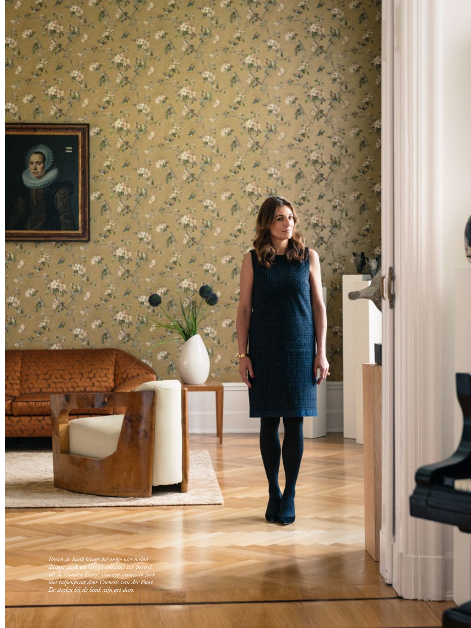
Boven de bank hangt het enige niet-hedendaagse werk uit Gnyps collectie: een portret uit de Gouden Eeuw, van een vrouw in jurk met tulpenprint door Cornelis van der Voort. De stoelen bij de bank zijn art deco.