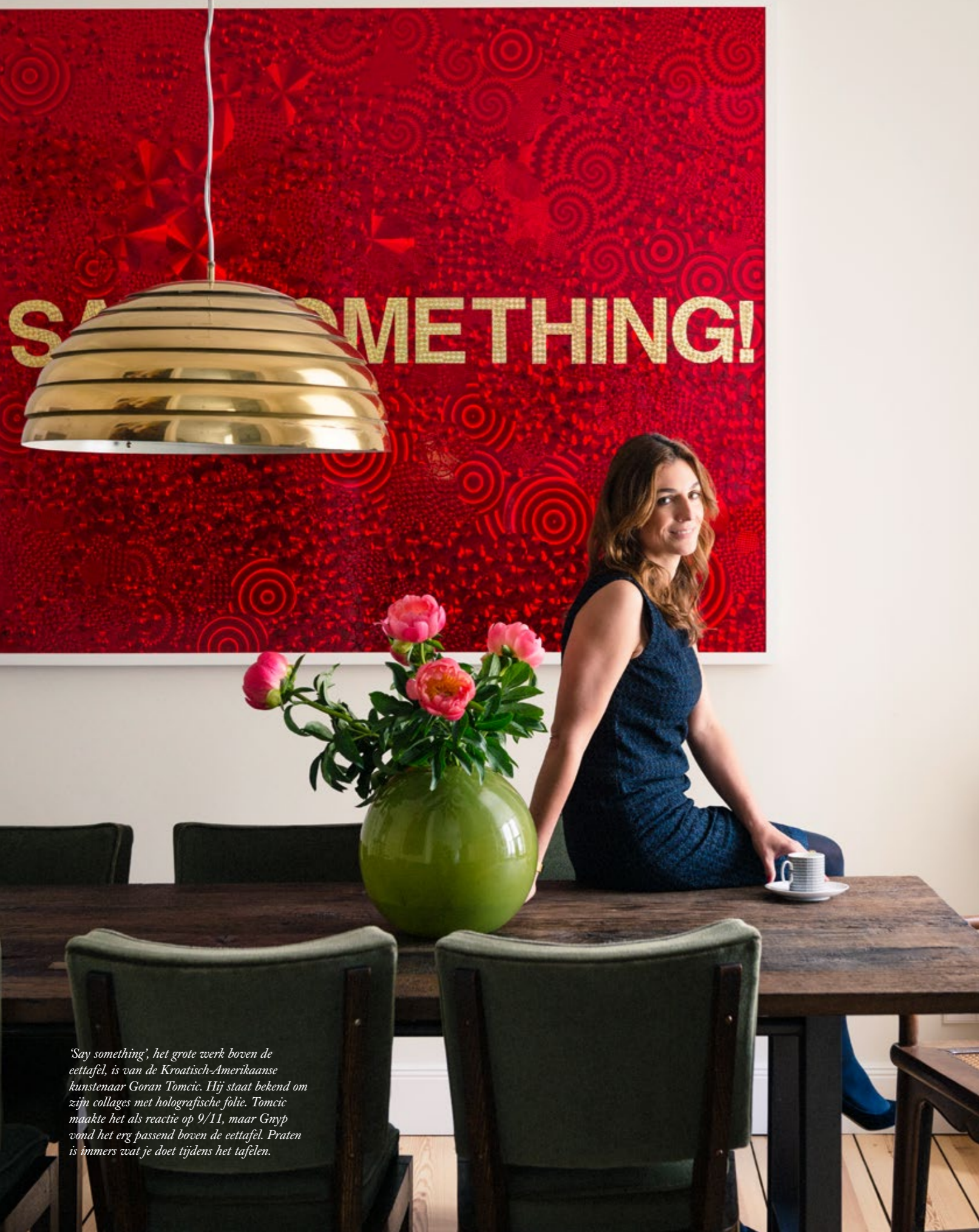
'Say something', het grote werk boven de eettafel, is van de Kroatisch-Amerikaanse kunstenaar Goran Tomcic. Hij staat bekend om zijn collages met holografische folie. Tomcic maakte het als reactie op 9/11, maar Gnyyp vond het erg passend boven de eettafel. Praten is immers wat je doet tijdens het tafelen.