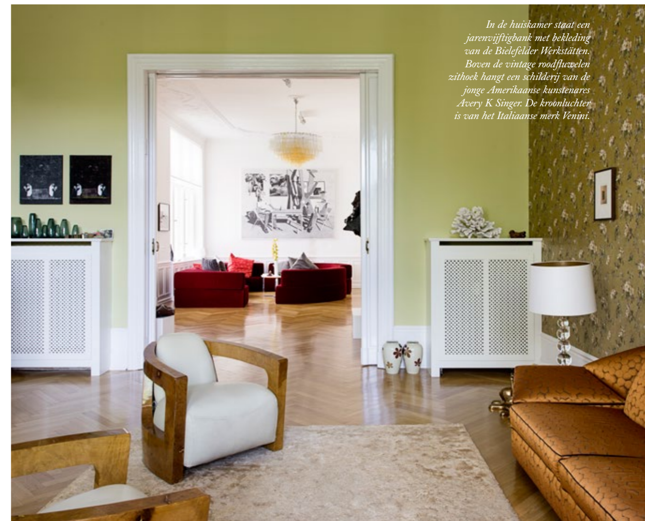
In de huiskamer staat een jarenvijftigbank met bekleding van de Bielefelder Werkstätten. Boven de vintage roodfluzelelen zithoek hangt een schilderij van de jonge Amerikaanse kunstenaar Avery K Singer. De kroonluchter is van het Italiaanse merk Venini.