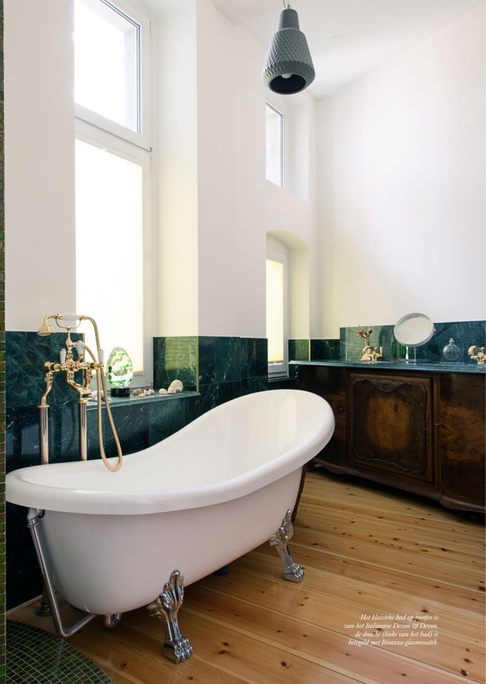
Het klassieke bad op pootjes is van het Italiaanse Devon & Devon, de douche (links van het bad) is betegeld met Bisazza-glasmozaïek.